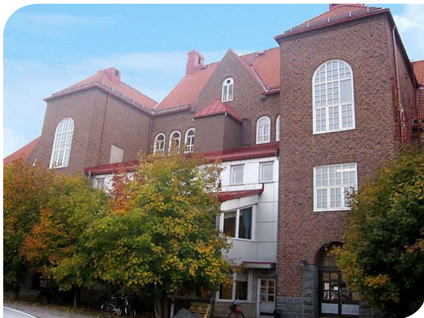
Vasaskolan, Norrlandsgatan 30