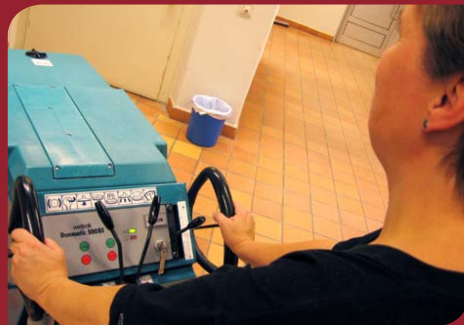
Layout & foto: Lars E Sundström