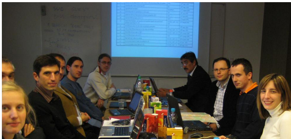
Projektmöte i Ljubljana, november 2008