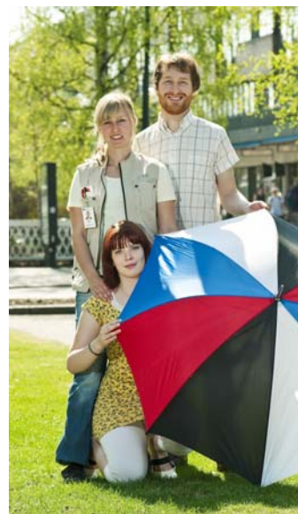
Studenter i socialtjänsten

Om du vill veta mer om Praktikcentrum finns det aktuell information om verksamheten på deras hemsida: www.umea.se/praktikcentrum