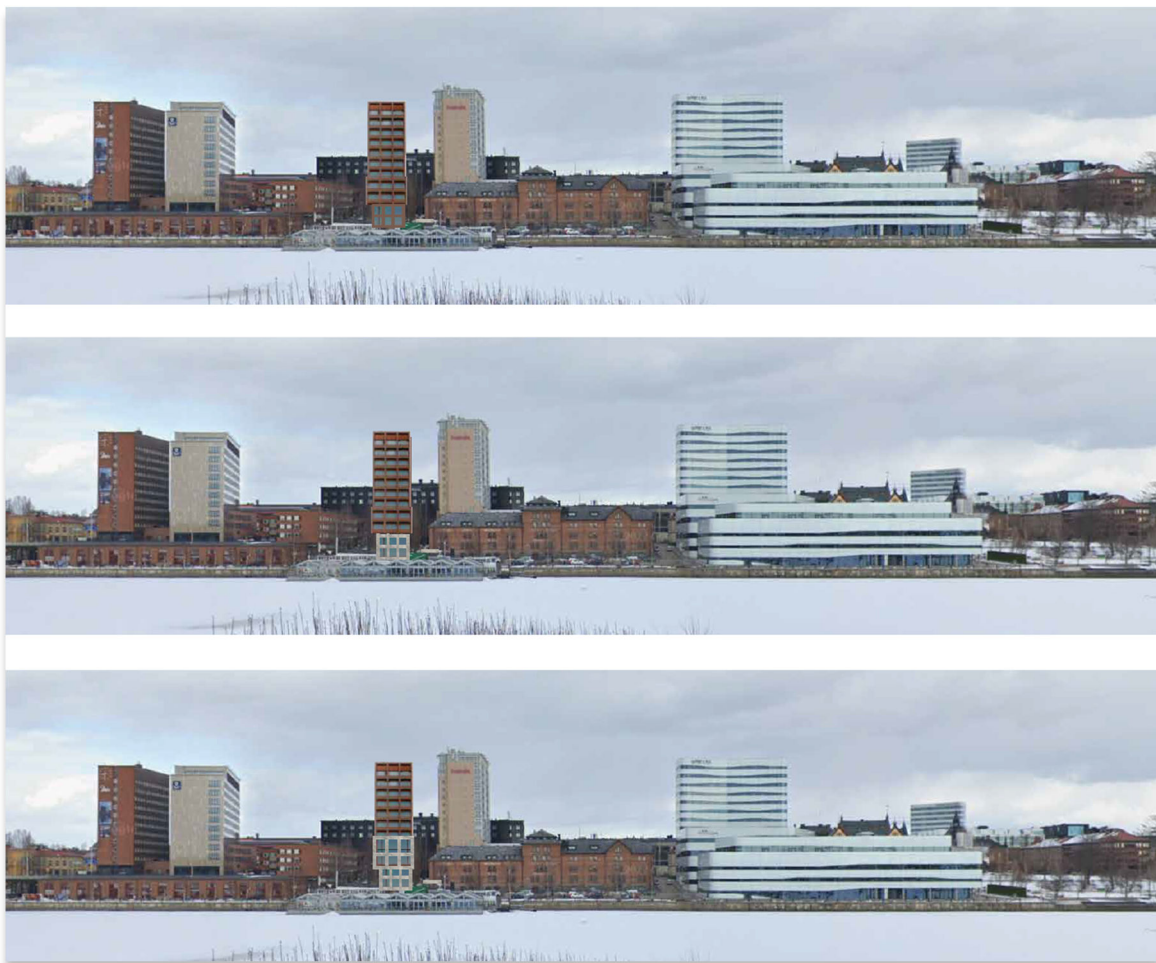
Kulör och materialstudie. Illustration: Sandellsandberg

Tillsammans med arkitekt har olika fasadmaterial och kulörer studerats genom illustrationer. I dessa studier undersöktes huruvida det är fördelaktigt att använda olika fasadmaterial för att bryta ner skalan och intrycket. Det framgick tydligt att så inte var fallet. Byggnaden och helhetsmiljön vinner på ett enhetligt fasadmaterial, företrädesvis i en dov färgskala. Det ger ett lugnare och mer harmoniskt intryck. För att bryta upp volymen förordas istället att man arbetar med fönstersättning och rytm. Nedan redovisas exempel från studien av material och kulörer.