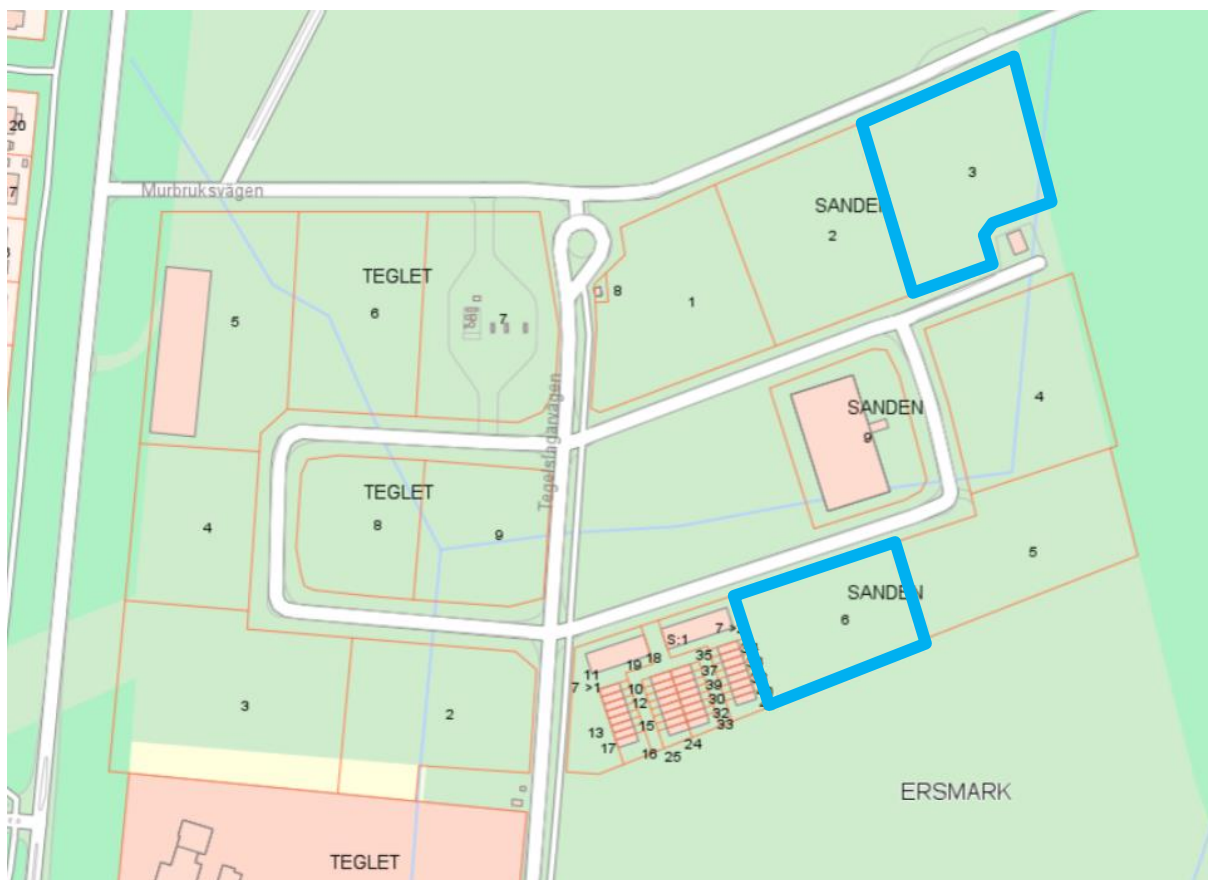
Figur 3. Karta över tomtindelning. Fastigheter markerade med blå kantlinje är tillgängliga. Övriga fastigheter är reserverade, köpta eller bebyggda.