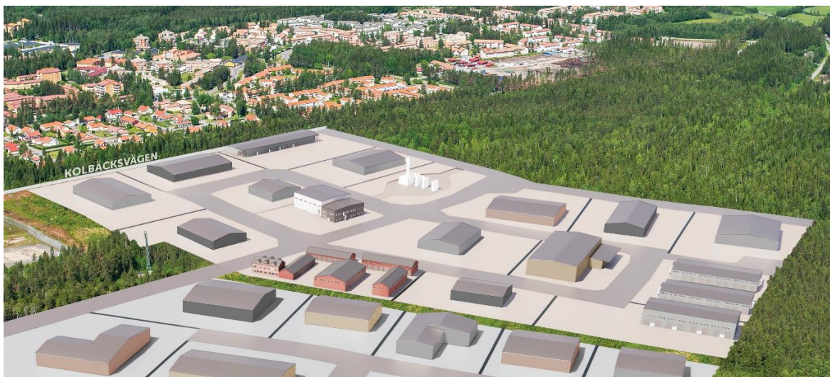
Figur 5. Illustration tänkt för byggnation av Östra Ersboda etapp 1. OBS! Illustrationen ska ses som en helhet och inte som en skiss för varje enskild tomt.