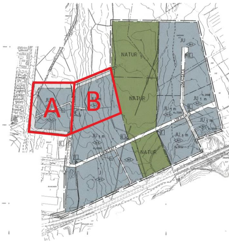
Figur 4. Urklipp från gällande detaljplan.

Nedan listas ett antal viktiga punkter som gäller för etapp 1, hela detaljplanen finns att studera på: https://lm.umea.se/kip/djvu/P12_2.djvu