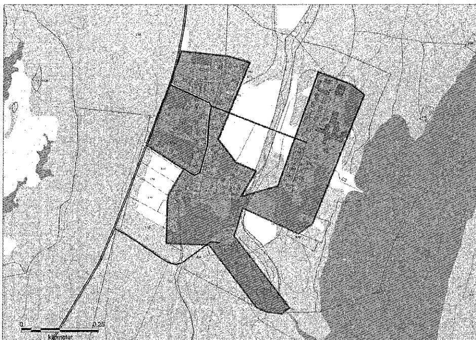
Föreslaget nytt verksamhetsområde Strömbäck

Miljö- och hälsoskydd tillstyrker ansökan. Dricksvattnet har bedömts tjänligt med anmärkning. Det finns där med anledning av detta skäl att utvidga verksamhetsområdet för vatten. Även två enskilda avlopp föreslås ingå utökat verksamhetsområde för avlopp. Eftersom recipienten har hög skyddsnivå är det ur miljöskyddssynpunkt positivt att i ett längre perspektiv ha en samlad lösning för avloppsfrågan.