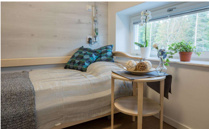
Exempel på materialval vid säng

Materialval , långsiktiga moderna materialval för att skapa en trevlig bomiljö samtidigt hålla låga kostnader för underhåll. Utsatta lägen för ökat slitage ska diskret förstärkas. Hårda/vassa hörn ska minimeras. Plastmatta med uppvik under golvlister. Ej tapeter. Låg bröstning på fönster i samvaro och högre vid säng. Minst ett öppningsbart men säkrat fönster (löstagbart handtag eller likvärdigt vid öppnande av fönstret helt) för vädring. Fönsterbänk, fäste gardinstång. Persiennor. Bostaden ska ha två placeringar för tv varav en placering ska eventuellt vara utformad med universalfäste för tv som fast montage. God mobil täckning, data/tv/telefoni. Brukaren ska ha möjlighet till utökat data/tv utbud som fastighetsägaren tillhandahåller.