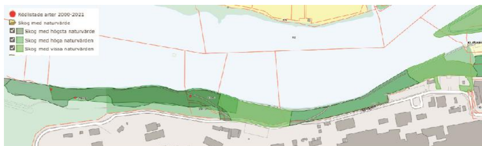
Figur 4. Karta över naturvärden längs älvbrinken.

Strandskogen längs älvbrinken har höga naturvärden som behöver beaktas i planläggningen, se figur 4.