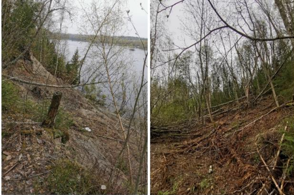
Figur 2. Bilder över älvbrinken från platsbesök.

stabilitetsutredning behöver utföras under planprocessen. Se även fördjupade översiktsplanen för älvlandskapet (sida 41) där det pekas ut ett behov av stabilitetshöjande åtgärder inom området.