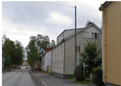
Gatuvy Storgatan österut

Sökanden önskar planläggning för att möjliggöra förtätning i form av bostäder. Användningen bostäder har stöd i gällande detaljplan och översiktsplan.