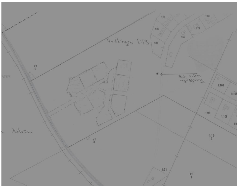
Illustration från ansökan.

Avgift för planbesked tas ut för mellanstor åtgärd med 11 960 kr.