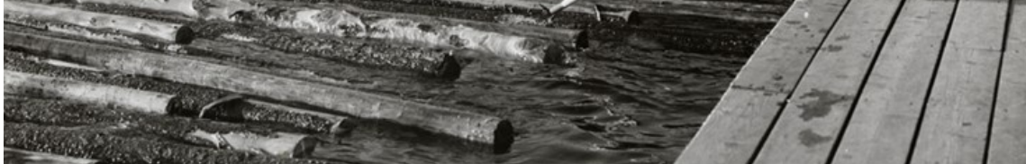
Timmerflotning på Umeälven – en vanlig syn i Umeå långt in på 1970-talet.

Under jubileumsåret samlar och sprider vi berättelser som handlar om Umeås historia, om det som har format Umeå och gjort staden till den plats där vi är i dag, om föreningar, idrottsrörelsen, kulturen, kyrkligheten, politiken, om näringsliv, utbildning och myndigheter. Människoöden och händelser är självklart viktiga inslag, liksom älvlandskapets betydelse.