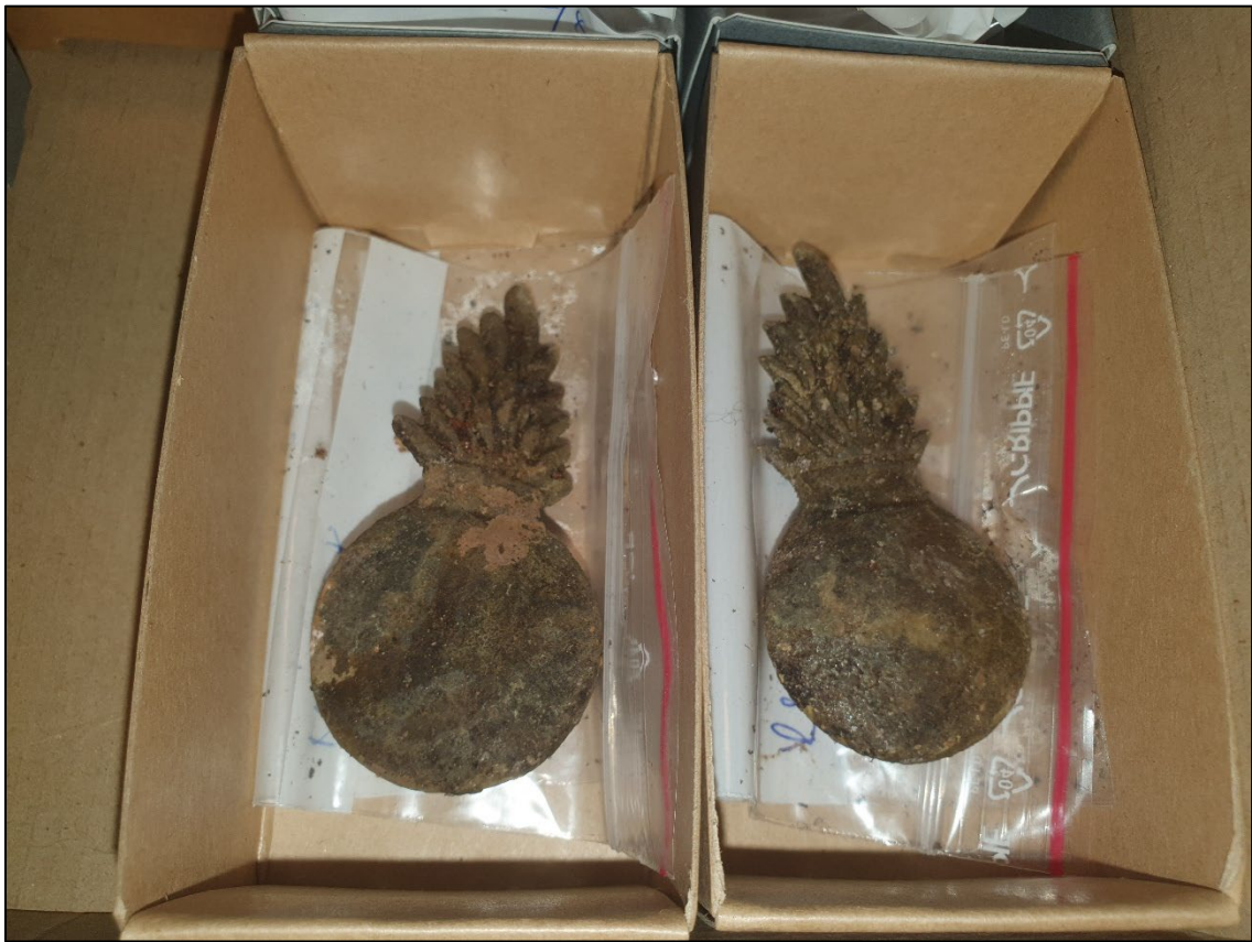
Fig. 3. Två av de fyra näst intill identiska emblemen.