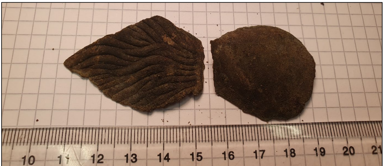
Fig. 4. Ett emblem av tunn mässings(?)plåt.