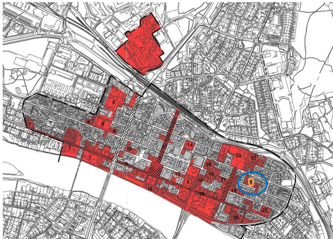
Karta som visar kärnområden i skriften Centrala Umeå och f.d. regementet. En kulturmiljö av riksintresse. Meddelande nr 8, 2009 . Valt område som anses påverkas (blå ring – område 17) och läge för aktuell plan (gul markering).