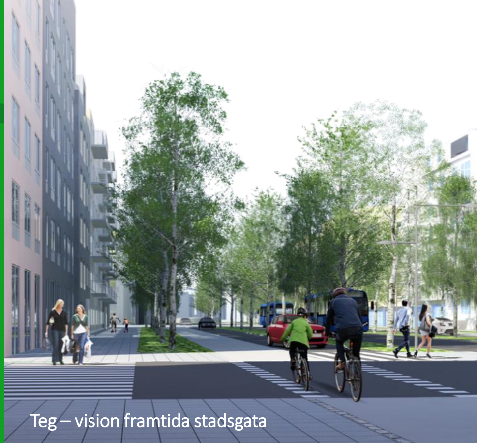
Teg – vision framtida stadsgata