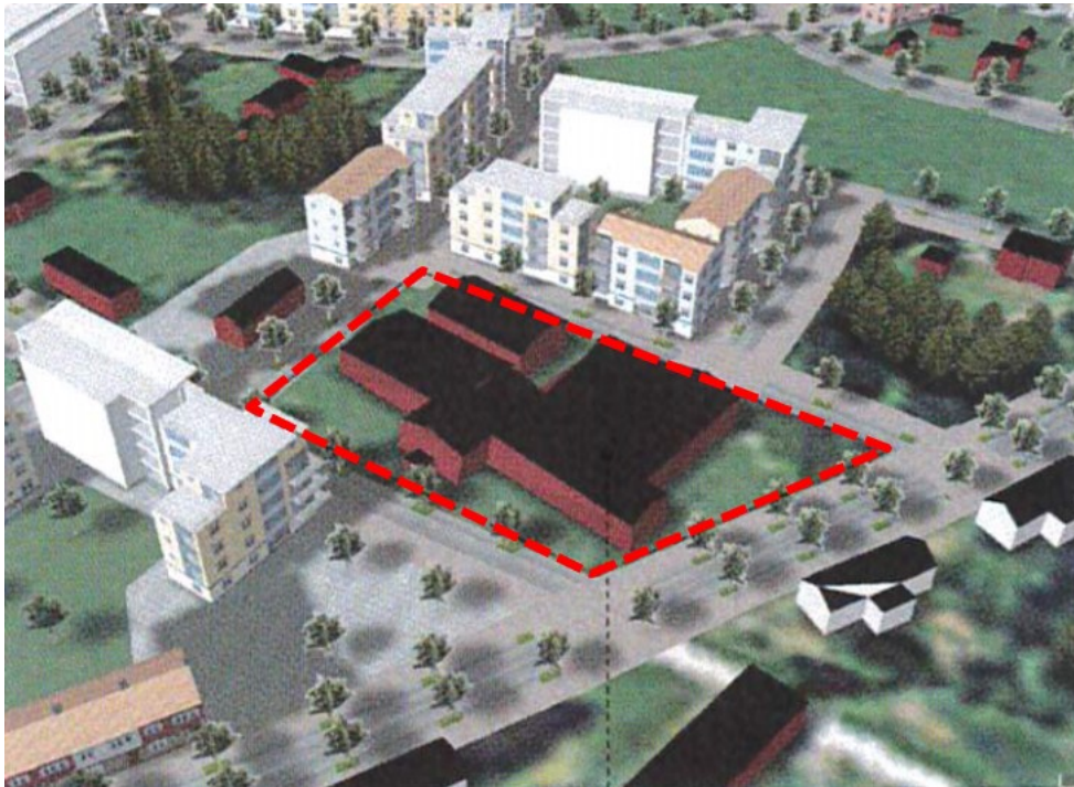
Figur 2 Illustrering av planområdet i fördjupning av Ön