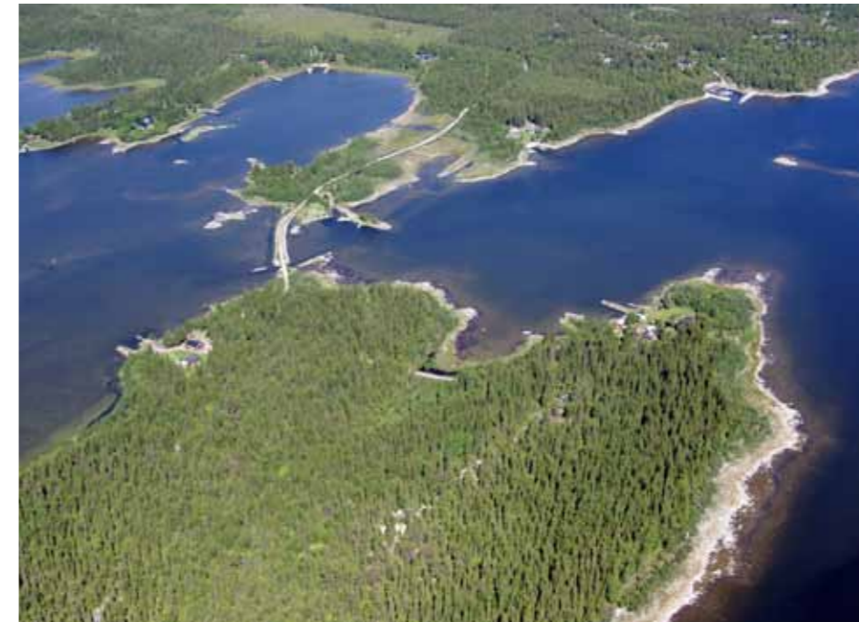
En hel del av bebyggelsen ligger utmed mycket grunda strandområden vilket innebär svårigheter att hitta bra lägen för båthamnar utan grävning och muddring. Bild från Ostögrundet.