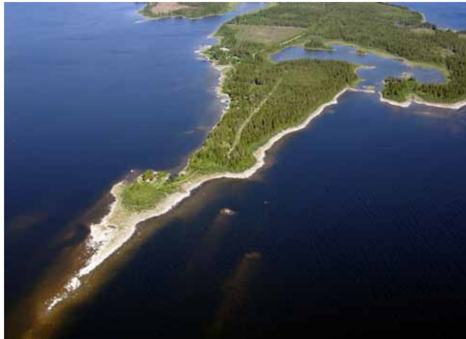
Sönerstgrundet är den yttersta udden i Sladans naturreservat, åtkomlig för allmänheten via en bilväg som slutar med en P-plats nära udden inom reservatet.

Bebyggelse finns främst i grupper utmed norra delen av Osnäshalvön, kring Osnäsfjärden och i norr kring Mittifjärden. En hel del av bebyggelsen ligger utmed mycket grunda strandområden och det har varit svårt att hitta bra lägen för båthamnar utan omfattande grävning och muddring. Närmaste service i form av skola och butik finns i Sävar. Ett stort antal tomter för ny bebyggelse finns inom detaljplanlagda områden.