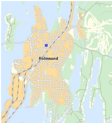
Fastigheten Vaktmästaren 27, Holmsund

Preliminärt syfte med planen är att inom området skapa planmässiga förutsättningar för utveckling av fastigheten genom utbyggnad av förskola samt vidgad användning av förskola respektive Lövö skola. Syftet är också, att ta tillbörlig hänsyn till den gamla skolans karaktär.