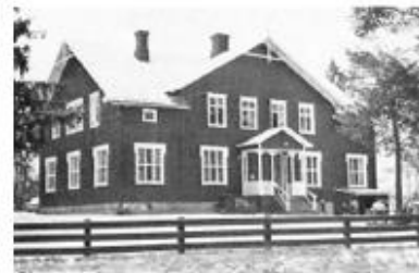
T.v. Fastigheten Vaktmästaren 27, Holmsund. T.h. Lövä skola, uppförd 1901.

Fastigheten innehåller idag Lövä förskola i väster och den år 1901 uppförda Lövä skola längre österut, nära en kraftig, skogsklädd sluttning. Området inhägnas med staket.