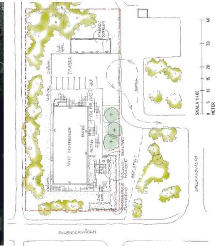
Figur 2. Situationsplan.