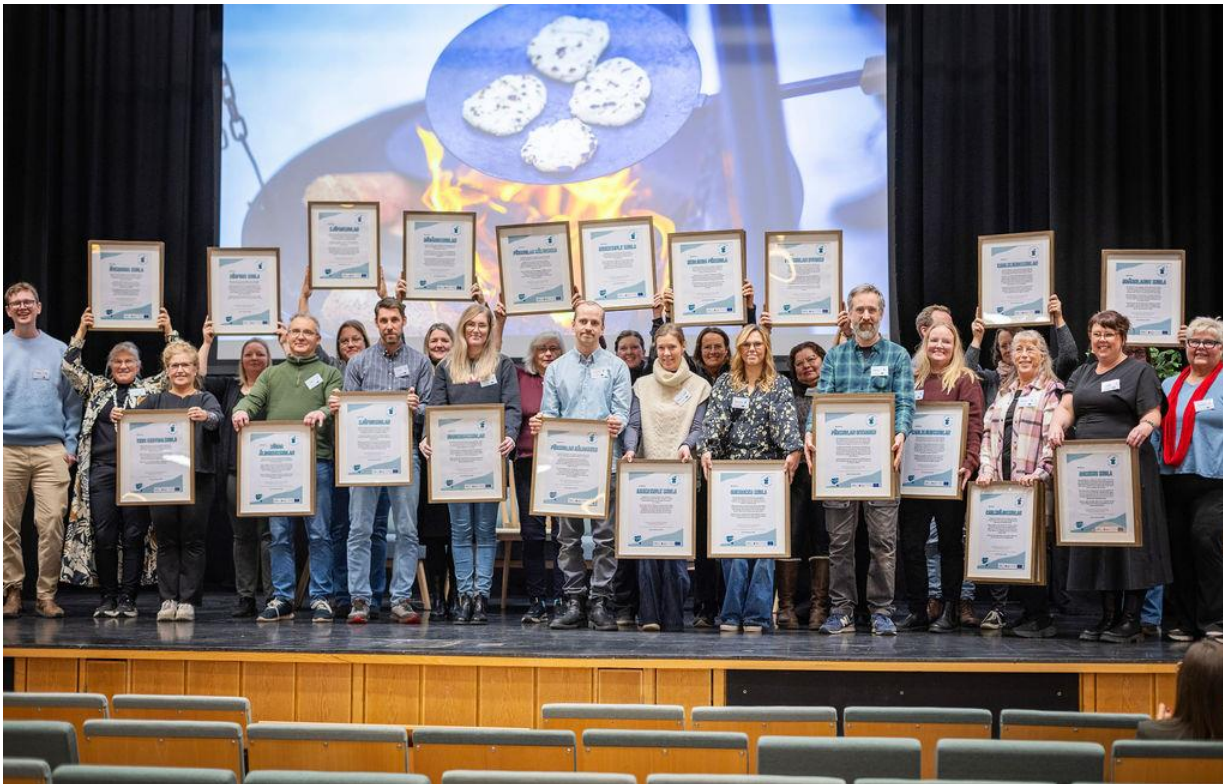
10 Alla deltagande förskolor och skolor, inklusive köken förärades med varsitt diplom under slutkonferensen