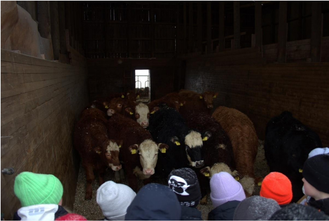
6 Besöken är en möjlighet för eleverna att uppleva livsmedelsproduktion i praktiken.