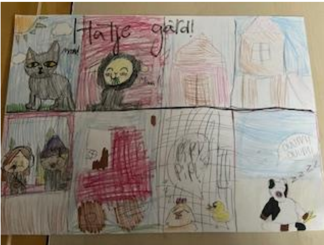
7 Efter besöket har eleverna dokumenterat sina upplevelser.