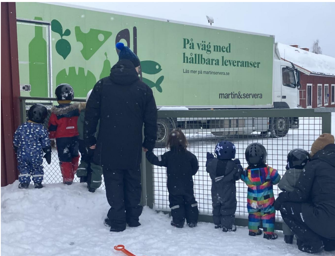
3 Barnen på förskolan Gitarren följer matleveransen med stort intresse

Marknadsdialoger inför upphandling har bidragit till ökad förståelse mellan kommunen och leverantörer och gjort det möjligt att utforma krav som både är ambitiösa och realistiska.