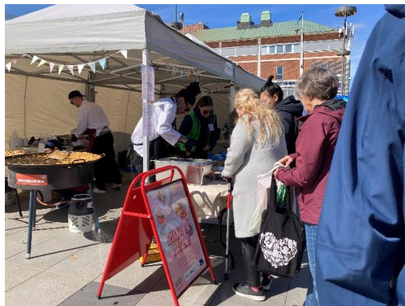
9 Kön till maten ringlade lång

Recepthäftet med elevfavoriter har haft ett liknande syfte – att visa att hållbar mat kan vara både uppskattad och möjlig att laga även hemma.