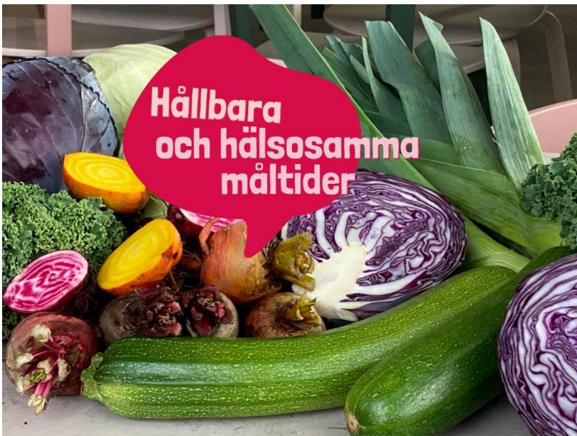
2 Klipp från den digitala utbildningen

Digitala utbildningar har också tagits fram tillsammans med Malmö stad och WWF. Dessa har behandlat frågor som klimatpåverkan, matsvinn, salladsbufféer och metoder för att öka acceptansen för vegetabiliska livsmedel.