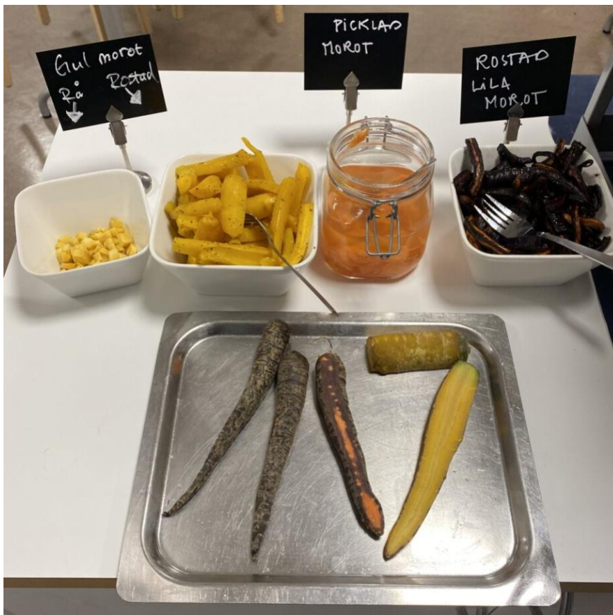
5 Veckans grönsak är ett sätt att väcka nyfikenhet på mat och visa hur en råvara kan smaka på många olika sätt beroende på hur man tillagar den.