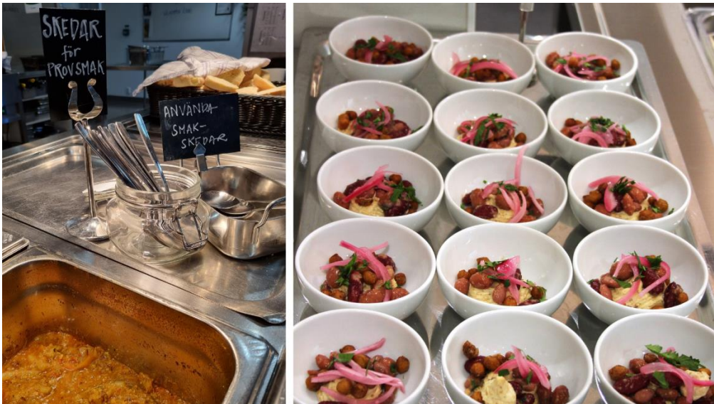
4 Smakskedar och portionsskålar kan underlätta för barnen att prova nya smaker och konsistenser.