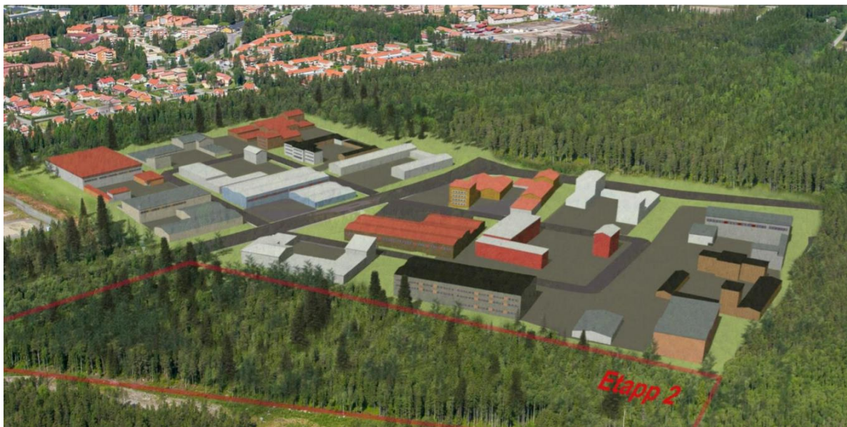
Illustration tänkt för byggnation av Östra Ersboda etapp 1. OBS! Illustrationen ska ses som en helhet och inte som en skiss för varje enskild tomt.

För tomterna närmast Kolbäcksvägen (Teglet 3, 4 och 5) kommer högre krav att ställas på gestaltning och typ av verksamhet.