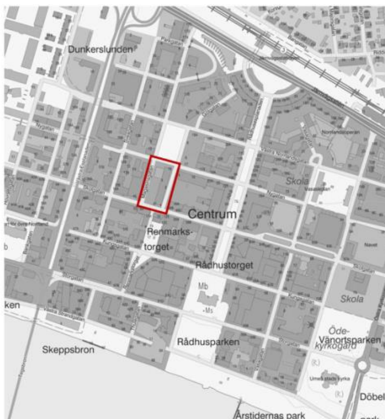
Figur 1 Karta över centrala Umeå. Utredningsområdet är avgränsat med röd markering. Planområdet med omgivande gator Magasinsgatan, Nygatan, Götgatan och Skolgatan.

Figur 1 visar en karta över centrala Umeå, fastigheten Saga 3 är markerad med en röd rektangel. Ett planförslag har tagits fram för fastigheten och syftet med förslaget är att skapa planmässiga förutsättningar att förtäta kvarteret Saga och skapa byggrätter för främst bostäder och kontor men även handel. Figur 2 visar en möjlig exploatering av fastigheten enligt planförslaget.