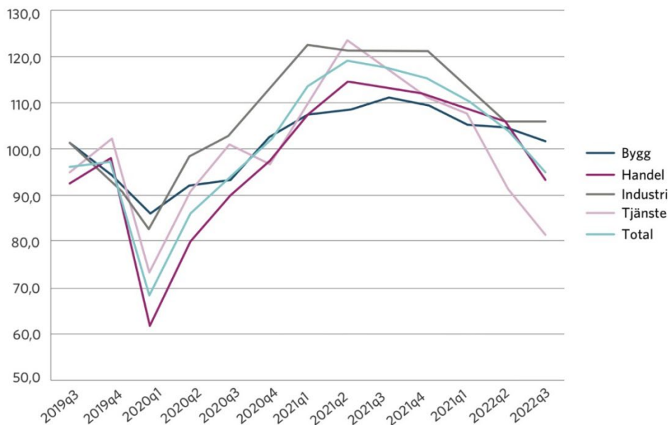
Figur 1. Konfidensindikatorn för näringslivet i Västerbotten har försvagats under 2022 i linje med övriga län och riket. Konfidensindikatorn tas fram genom en företagsenkät och mäter nuläget i näringslivet samt hur företagen ser på den närmaste framtiden

Umeås näringsliv karaktäriseras av en väldigt stor branschbredd och en diversifiering med en tredjedel anställda inom tillverkande industri, företagstjänster samt platstjänster. Det har tidigare inneburit att Umeå klarat konjunktursvängningar betydligt bättre än de flesta andra platser. Till det kommer också det stora inslaget av offentliga arbetstillfällen som är mindre känsliga för skiftningar i konjunkturen.